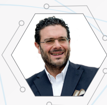
ERNESTO CARBONE Parlamentare della Repubblica