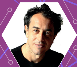
MATTEO GARRONE Regista