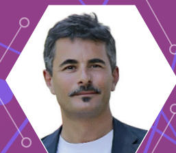
PAOLO GENOVESE Regista