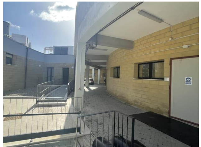
Particolari del portico dell'Ospedale Veterinario (OVUD)