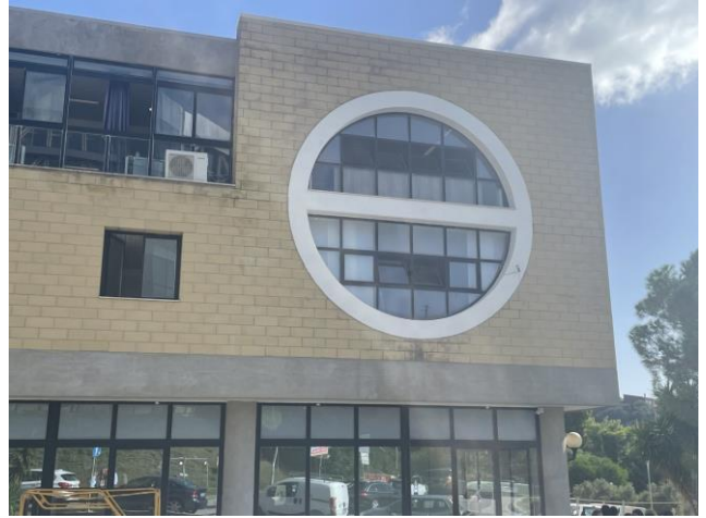
Viste delle facciate del Dipartimento di Scienze Veterinarie