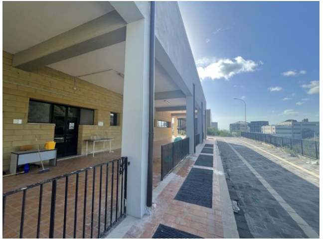
Particolari dei pilastri del porticato esterno all'Ospedale Veterinario (OVUD)