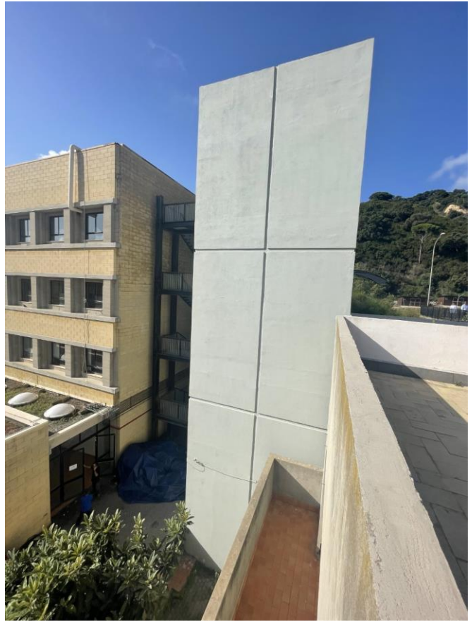
Particolari dei vani ascensori esterni all'Ospedale Veterinario (OVUD)