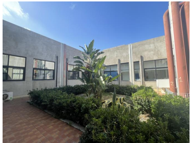
Viste del cortile all'interno dell'Ospedale Veterinario (OVUD)