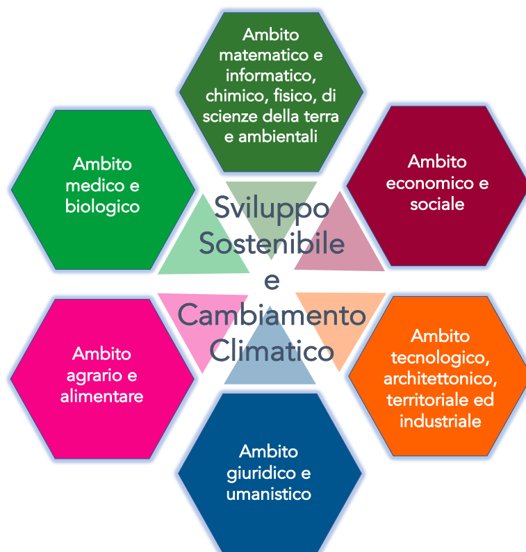
Figura 1 – Schema degli ambiti curriculari formativi e di ricerca, accomunati dall’obiettivo di contribuire allo sviluppo sostenibile e a trovare soluzioni al problema del cambiamento climatico.

Il raggiungimento di questo obiettivo permetterà di creare una comunità scientifica di docenti ed allieve/i che siano in grado di affrontare la complessità del tema contribuendo con strumenti e visioni di discipline diverse, ma avendo un linguaggio ed un traguardo comune.