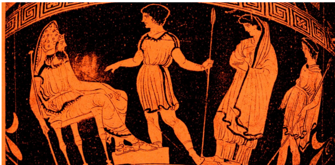
Antigone accompagnata da due guardie viene portata davanti a Creonte (vaso del IV sec. a.C. conservato al British Museum)

Ordinario di Filosofia del diritto nell'Università degli Studi di Messina