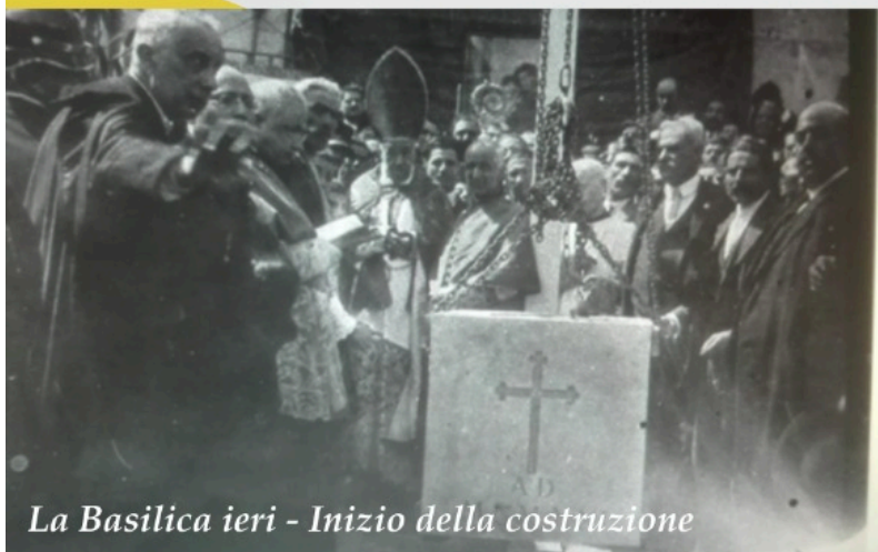
La Basilica ieri - Inizio della costruzione

"L'evento si svolgerà nel rispetto delle norme anti Covid e per accedere all'Aula Magna è necessario essere in possesso di green pass". E' previsto il riconoscimento di 0,25 CFU a tutti gli studenti UniMe che seguiranno il convegno.