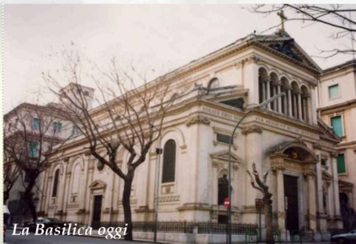
La Basilica oggi