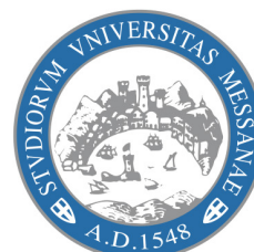
logomarchio verticale a colori