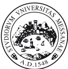
logomarchio orizzontale in b/n