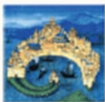
Ordine degli Avvocati di Messina