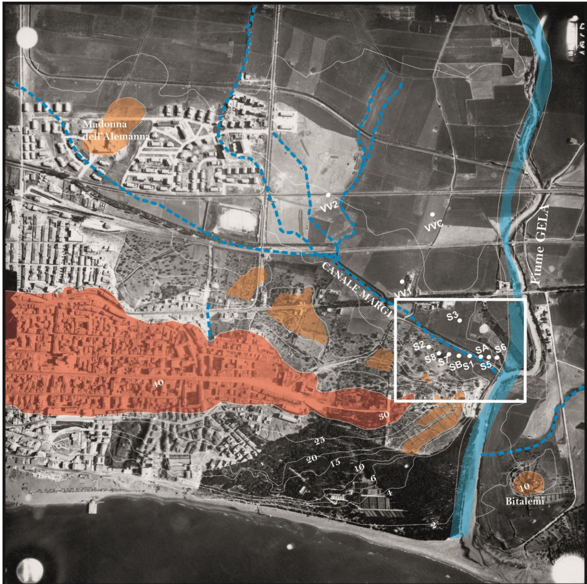
Carta Geologico-geomorfologica schematica su foto aerea del 1954. In arancio, le superfici terrazzate di origine marina di età Pleistocenica; in blu, il reticolo idrografico inerente al Canale antropico Margi, confluyente in dx orografica del Fiume Gela; in bianco, carotaggi per il Collettore fognario di via Venezia. Nel riquadro, l'area oggetto delle nostre indagini geognostiche. (immagine tratta da: SPAGNOLO G. - AMATO V. - D'AMICO S. - COLICA E. - GALONE L., Gela: ipotesi di localizzazione del porto della città arcaica e classica , Atti XVII Rassegna Internazionale di Archeologia subacquea, Giardini-Naxos, 7-9 ottobre 2021, in corso di stampa).