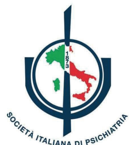
SIP Società Italiana di Psichiatria