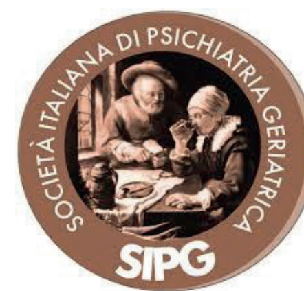
SIPG Società Italiana di Psichiatria Geriatrica

Grazie al contributo non condizionato di: