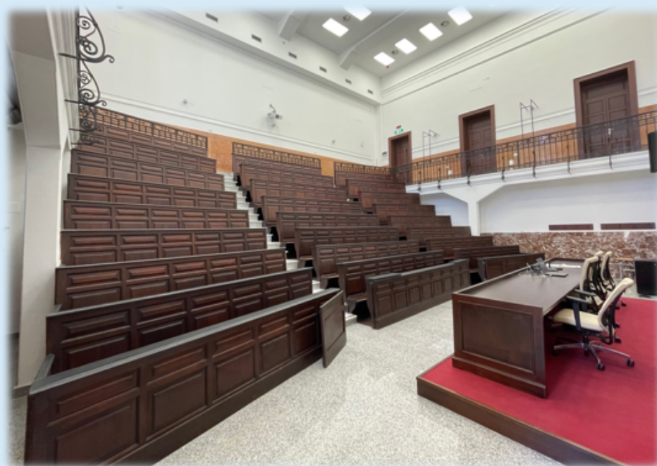
Sede centrale, Piazza S. Pugliatti, 1