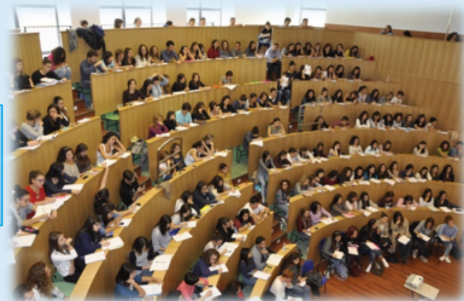
Aulario di Via P. Castelli

Aule ampie e funzionali, Reti di comunicazione, Strumenti informatici