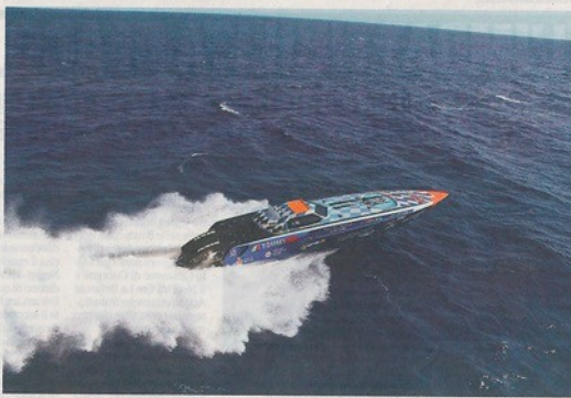
Tommy One, una Meta Marine, costruita in kevlar e fibra di carbonio, negli omonimi cantieri di San Benedetto del Tronto