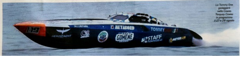
La Tommy One parteciperà nelle Cowes Torquay Cowes in programma il 27 e 28 agosto