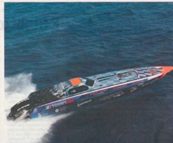
Tommy One, una Meta Marine, costruita in kevlar e fibra di carbonio nei cantieri di San Benedetto del Tronto