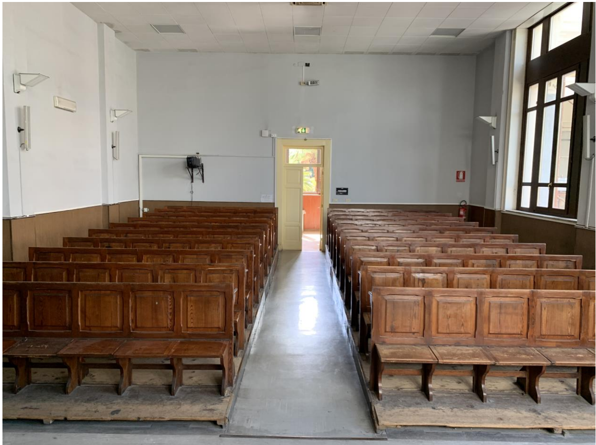
Aula 1 Sede di Messina